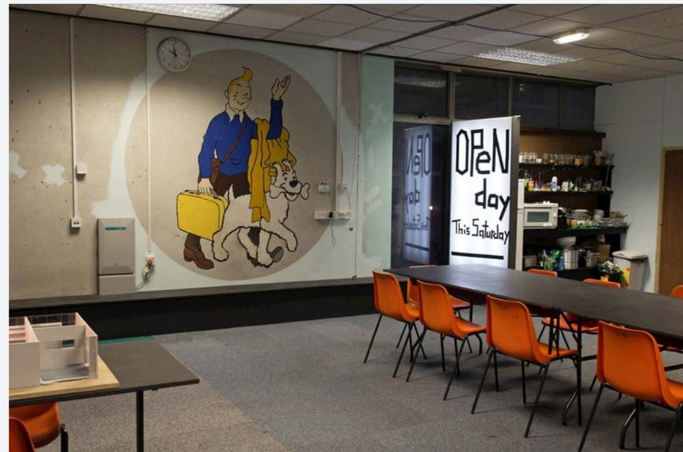
*图为RCA学校研讨会一角

London visit/Departure Day End of the Summer School