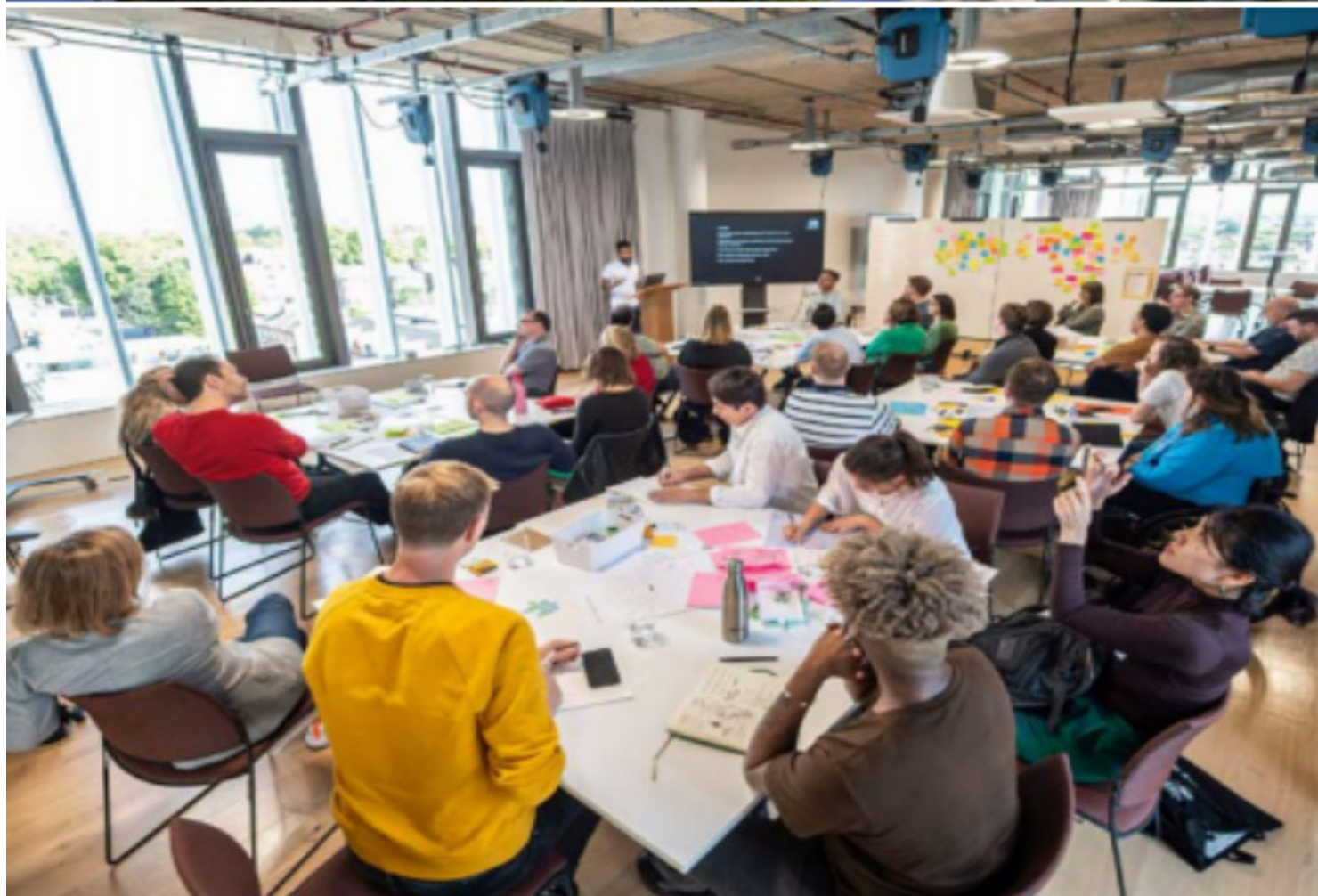
*图为皇家艺术学院新高管教育空间、劳森研发创新大楼