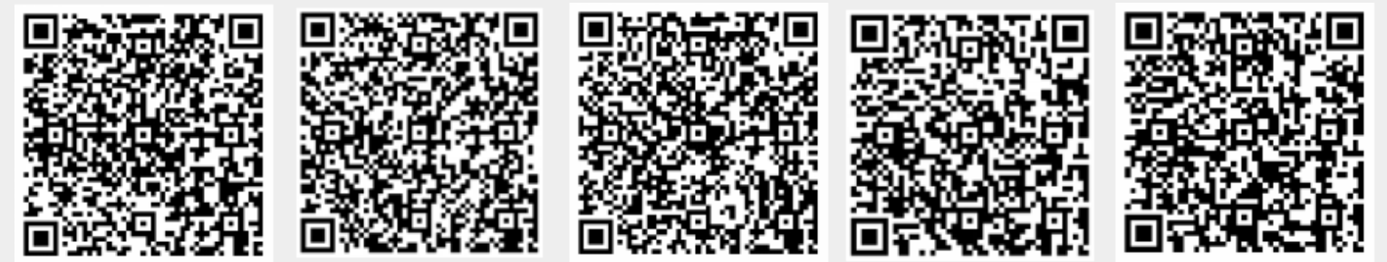
*图为往期Summer / Winter School校友的视频分享的二维码