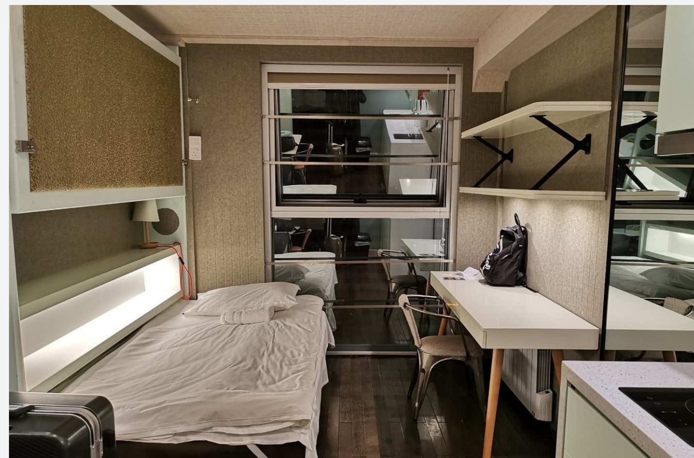
*图为本次summer school住宿房间