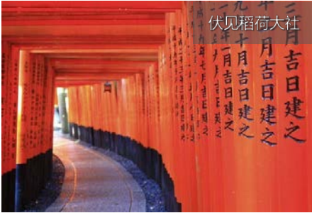
伏见稻荷大社 二月吉日建之 一月吉日建之 九月十日吉日建之