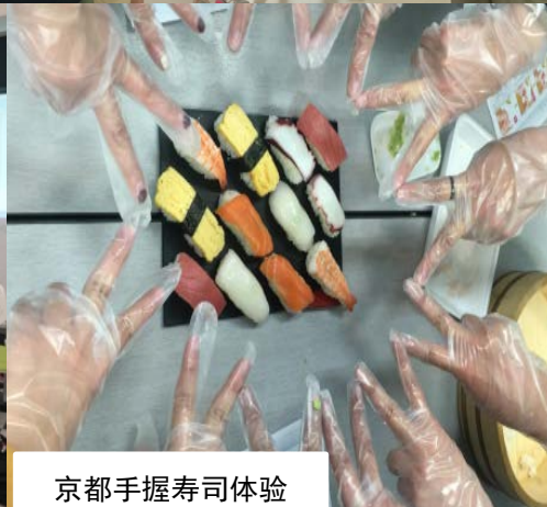
京都手握寿司体验