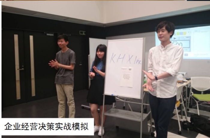
企业经营决策实战模拟