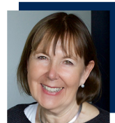
Professor Dame Frances Ashcroft 英国皇家学会院士 英国医学科学院院士 大英帝国勋章获得者