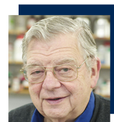
Professor Sir Walter Bodmer 英国皇家学会院士 爵士头衔