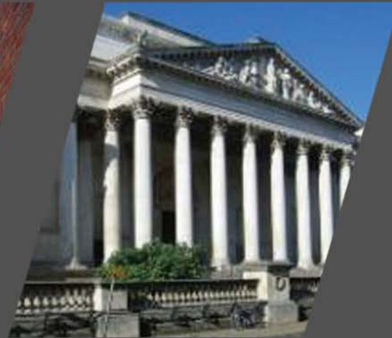
The Fitzwilliam Museum (菲茨威廉博物馆)

国际上研究中国古代科技文化的四大中心之一。创办人李约瑟先生是英国皇家学会会员, 著名的生物化学家。为中国丰富悠久的历史文化所吸引, 转而研究中国的科学技术与文明。他所提出的“李约瑟难题”受到国际学术界的广泛关注和研讨。