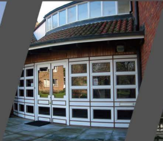
Needham Research Institute (李约瑟研究所)

英格兰银行自1694年以来作为英国的中央银行, 对英国国家的货币政策负责。英格兰银行是世界上最早形成的中央银行, 为各国中央银行体制的鼻祖, 是全世界最大、最繁忙的金融机构。