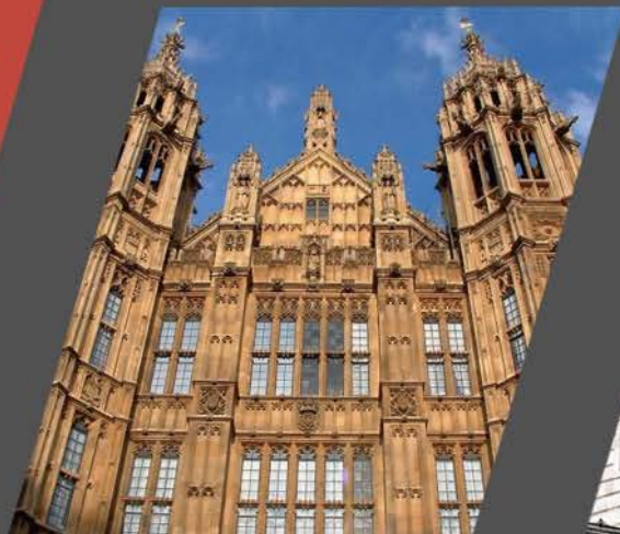
Houses of Parliament (议会大厦)

威斯敏斯特宫 (Palace of Westminster), 又称国会大厦。矗立于泰晤士河畔, 是英国国会的所在地。威斯敏斯特宫是哥特复兴式建筑的代表作之一, 同时也是世界最大的哥特式建筑之一, 占地三万平方公尺。1987年被列为世界文化遗产。