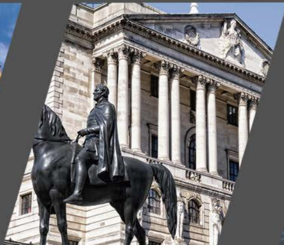
Bank of England (英格兰银行)

威斯敏斯特宫 (Palace of Westminster), 又称国会大厦。矗立于泰晤士河畔, 是英国国会的所在地。威斯敏斯特宫是哥特复兴式建筑的代表作之一, 同时也是世界最大的哥特式建筑之一, 占地三万平方公尺。1987年被列为世界文化遗产。