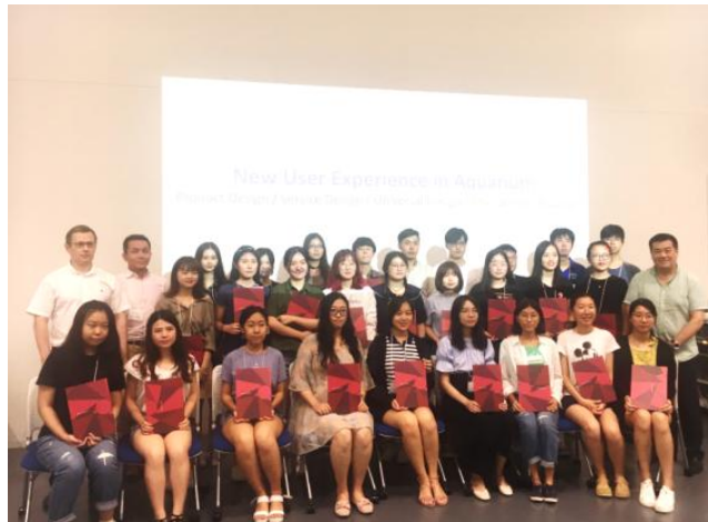
(往届线下课程结业证书颁发现场)