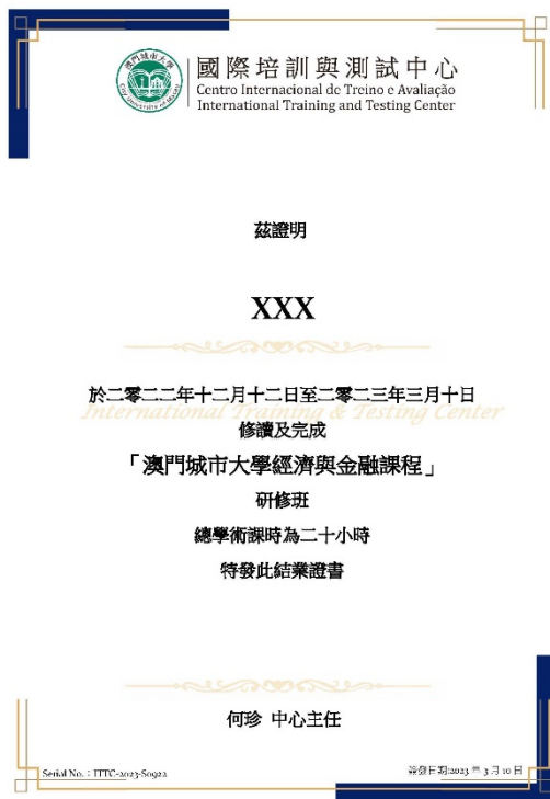
访学结业证书样张